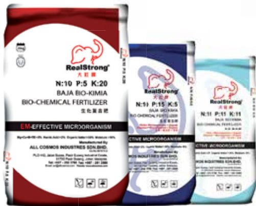
MAX 99 Max 33 Max Growth